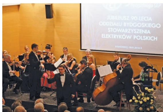
Rys. 10. „Koncert z uśmiechem” w wykonaniu Orkiestry im. Johanna Straussa

Po uroczystym wręczeniu odznaczeń, medali i wyróżnień oraz po wystąpieniach okolicznościowych odbył się „Koncert z uśmiechem” w wykonaniu Orkiestry im. Johanna Straussa z elementami związanymi z elektrotechniką (rys. 10).