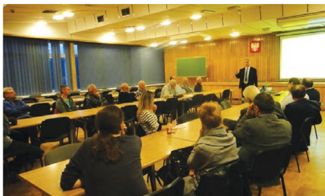
Rys. 21. Pierwsze spotkanie tematyczne w ramach Klubu Czwartki z Elektryką (26 października 2017 r.)