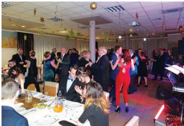
Rys. 13. Zabawa na Balu Elektryka

Wielką chlubą Oddziału Bydgoskiego Stowarzyszenia Elektryków Polskich jest młodzież. Każde środowisko, bez aktywnego działania młodych, prędzej czy później będzie musiało zakończyć