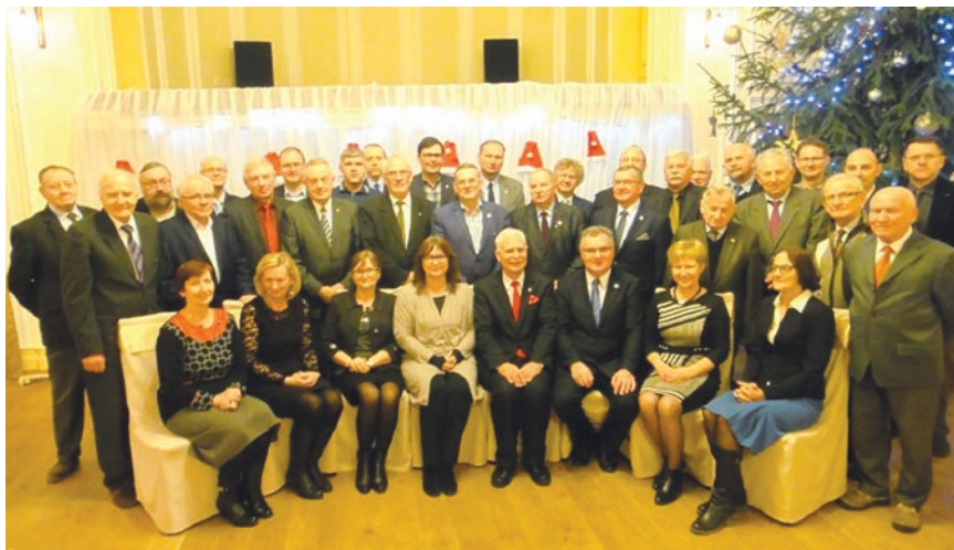
Rys. 19. Spotkanie świąteczne członków i sympatyków Oddziału Bydgoskiego SEP z udziałem prezesa Stowarzyszenia Elektryków Polskich (15 grudnia 2016 r.)