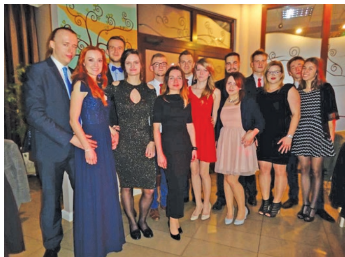
Rys. 15. Nadzieja na rozwój Stowarzyszenia Elektryków Polskich – młodzież Oddziału Bydgoskiego SEP

swą działalność. Oddział Bydgoski SEP patrzy w przyszłość z wielką odwagą i nadzieją na rozwój, a podstawą do tego jest właśnie działalność młodych osób w Stowarzyszeniu. Zabawa na Balu Elektryka (rys. 15) była odprężeniem po ogromnym wysiłku i zaangażowaniu w organizację i profesjonalny przebieg gali jubileuszowej.